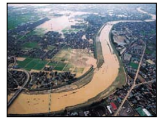
＜近年の大規模災害における支払保険金＞